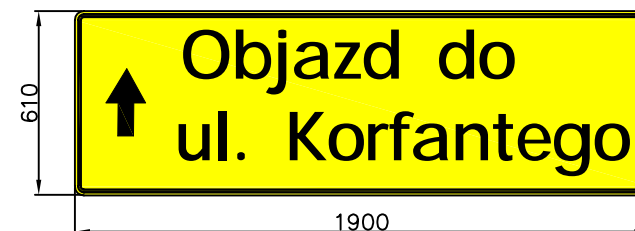
Tablica nr 4

Wlot ul. Chorzowskiej od Lipin przed ul. Korfantego