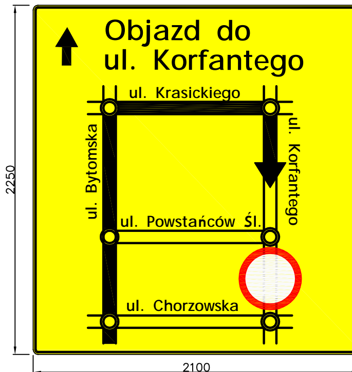
Tablica nr 3

Wlot ul. Bytomskiej od Bytomia przed ul. Chorzowską